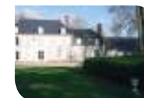
3 Château de Villeprévost