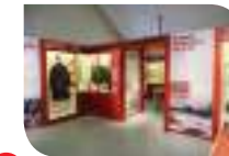
4 Musée de la guerre de 1870

La Maison du Tourisme peut également vous aider à créer votre parcours personnalisé en fonction de vos attentes, de vos envies, de la durée de votre séjour.