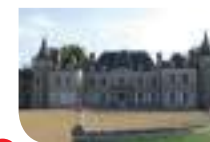
2 Château de Combray