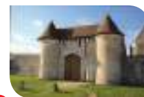
1 Abbaye de Notonville

À travers les chemins et routes de Beauce, découvrez des sites patrimoniaux chargés d'histoire ou encore des lieux de mémoire, témoins de la bataille du 2 décembre 1870 à Loigny.