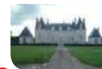
5 Château de Villepion